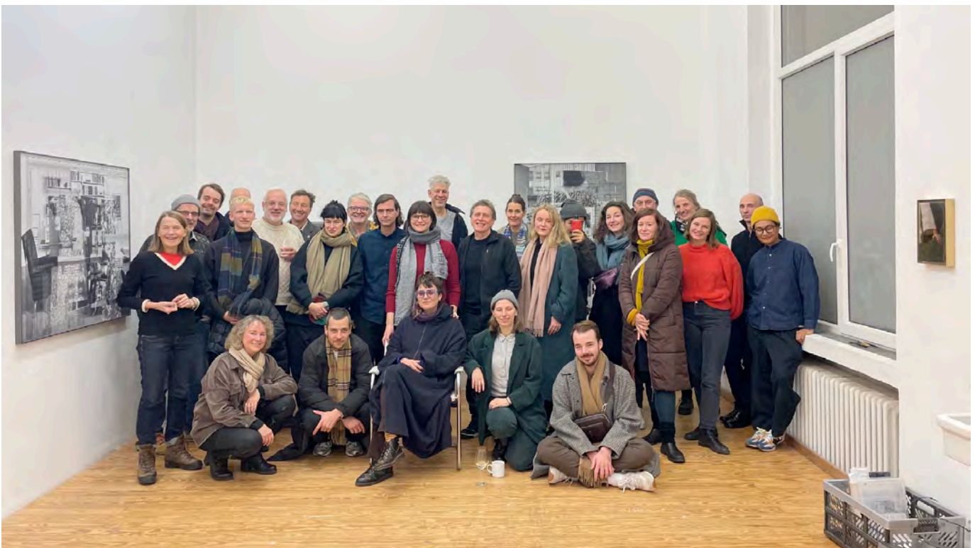
kunstenaars en betrokken partners van Borderland Residencies 2023

De Borderlands editie van 2023 werd in april 2024 afgesloten met de tentoonstelling Speaking Soil in Sammlung Philara in Düsseldorf. De Nederlandse consul-generaal te Düsseldorf opende de tentoonstelling in bijzijn van bijna 900 bezoekers!