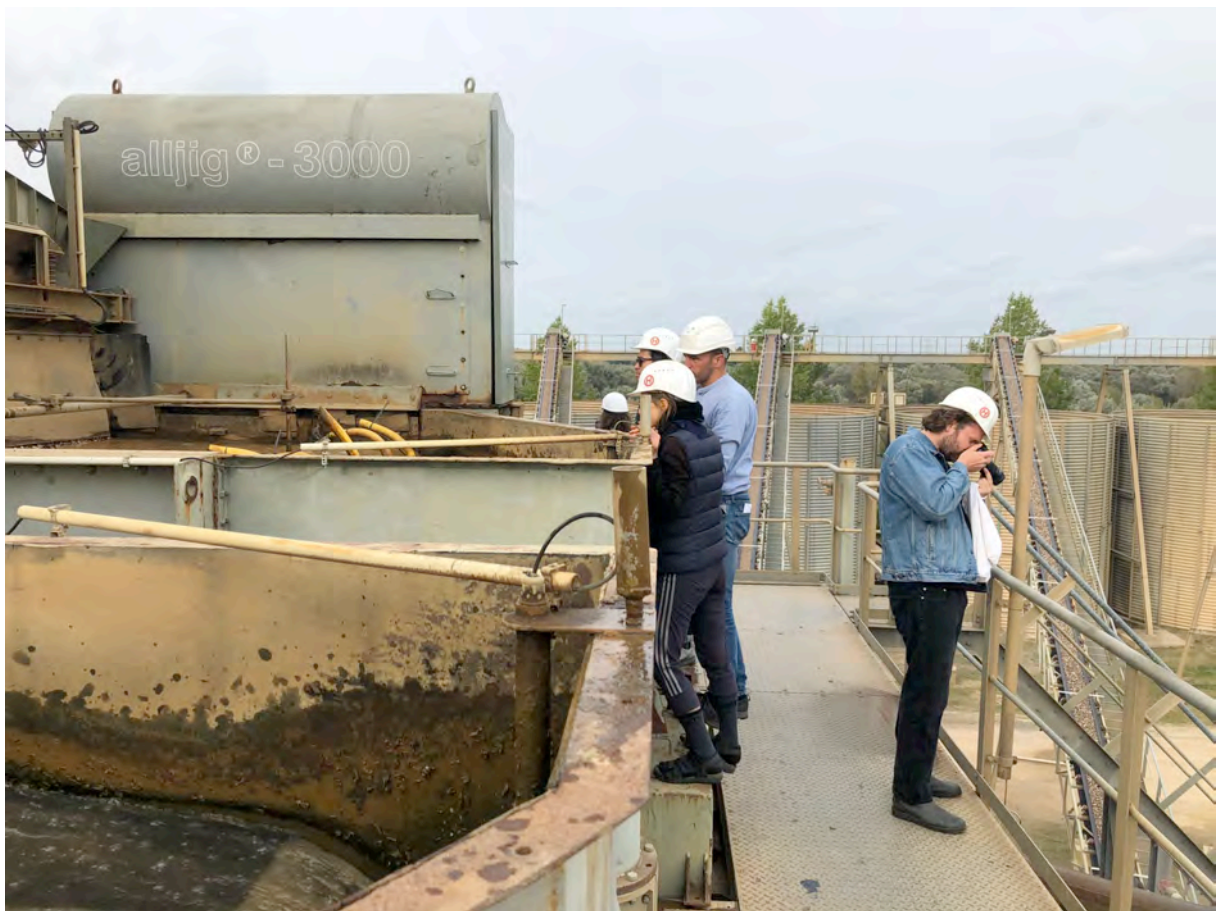
bezoek aan grindfabriek 'Milchplatz' in Wesel