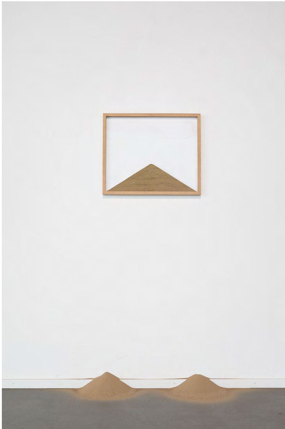
werk van Koen Kievits

je kijkrichting te veranderen. Deze kunstenaars fluisteren, spelen, en prikkelen de zintuigen op een subtiele en indirecte manier; het gaat niet over radicaliteit. Echo's, schaduwen en negaties van voorwerpen zijn de middelen waarmee ze dat doen. Ze nodigen uit om je eigen mogelijkheden te verkennen om de vertrouwde blik te verlaten en nieuwe zienswijzen toe te laten, zonder dat je er bewust toe aangezet wordt. De verschuiving van aandacht biedt een ander perspectief op het vertrouwde. Het bekende verschijnt zodoende in een nieuw daglicht.