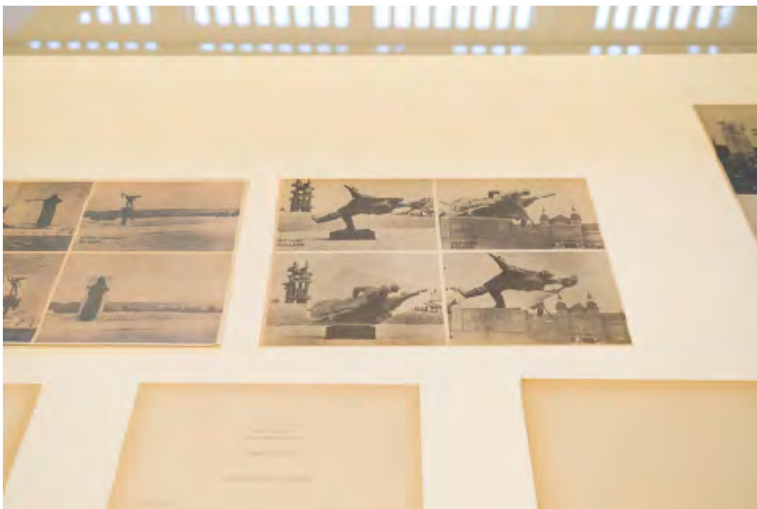
Commemor van Robert Filliou