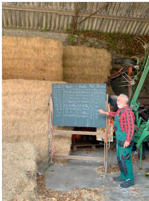
uitleg bij boerderij Hof Richtersgut